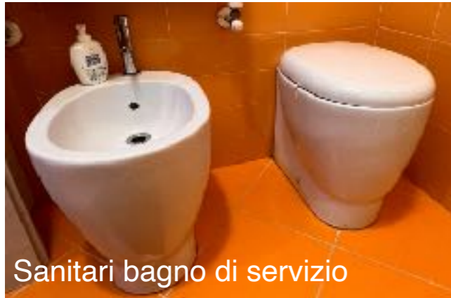
Sanitari bagno di servizio