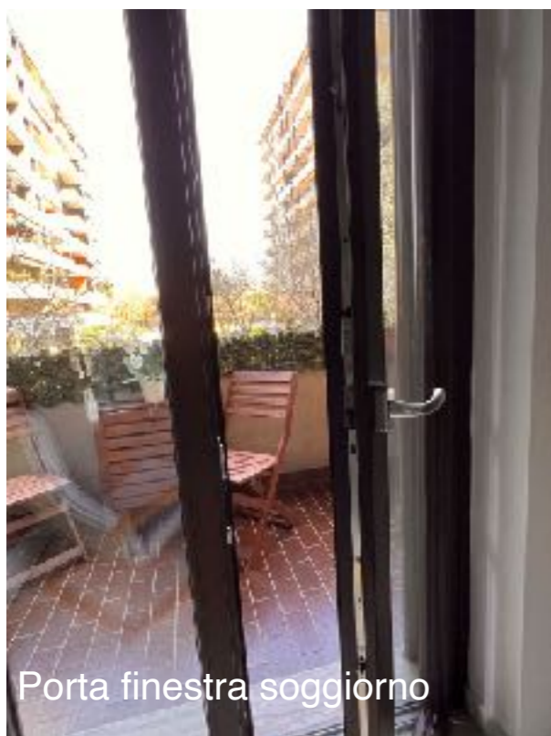
Porta finestra soggiorno