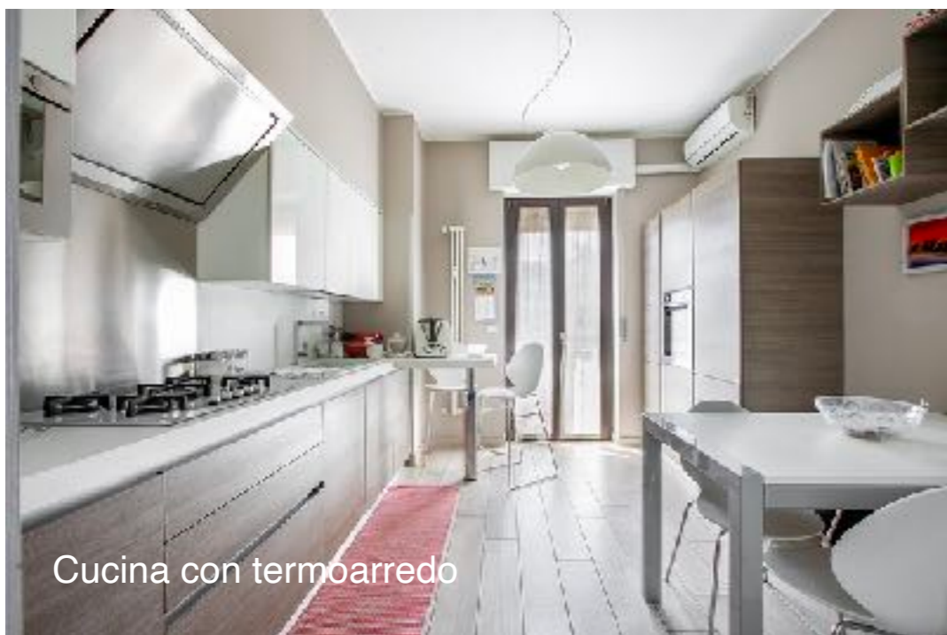
Cucina con termoarredo