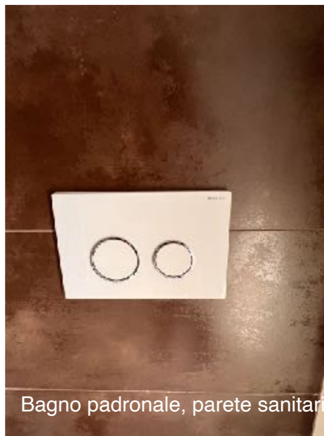
Bagno padronale, parete sanitari

Pareti doccia: piastrelle di ceramica effetto listello 5x20, posa orizzontale, formato 20x20.