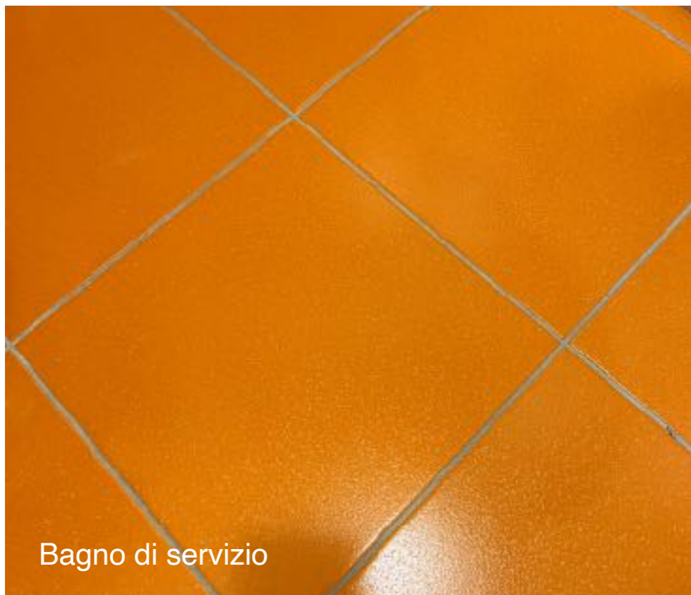
Bagno di servizio