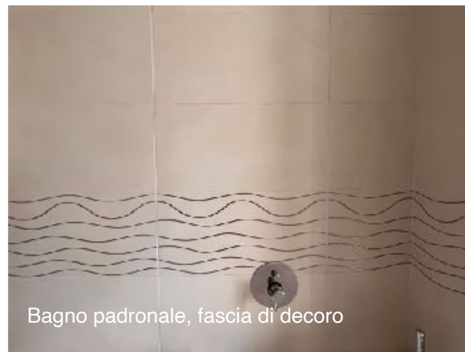
Bagno padronale, fascia di decoro