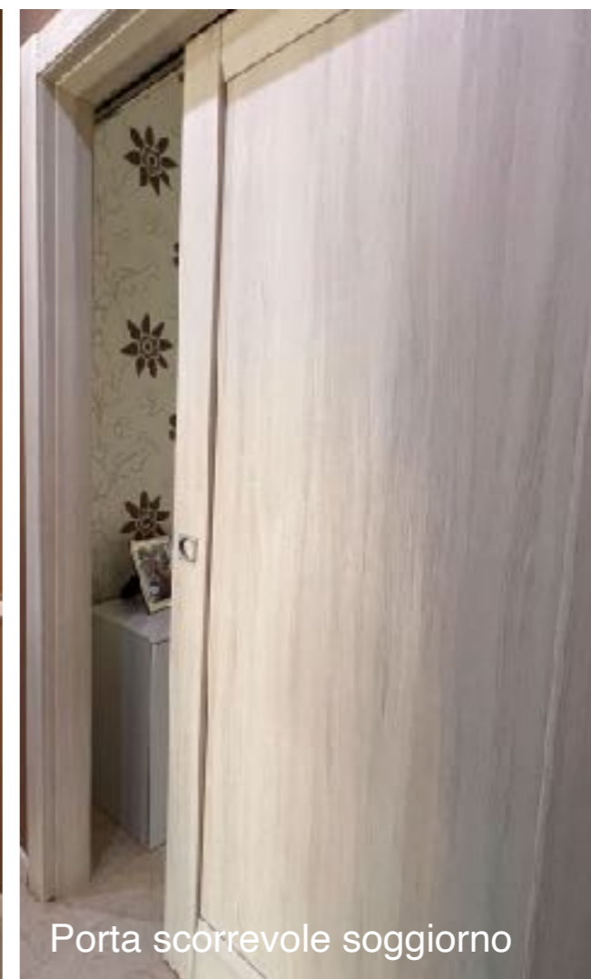
Porta scorrevole soggiorno