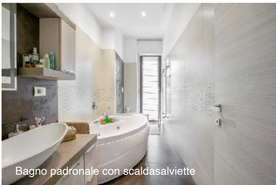
Bagno padronale con scaldasalviette