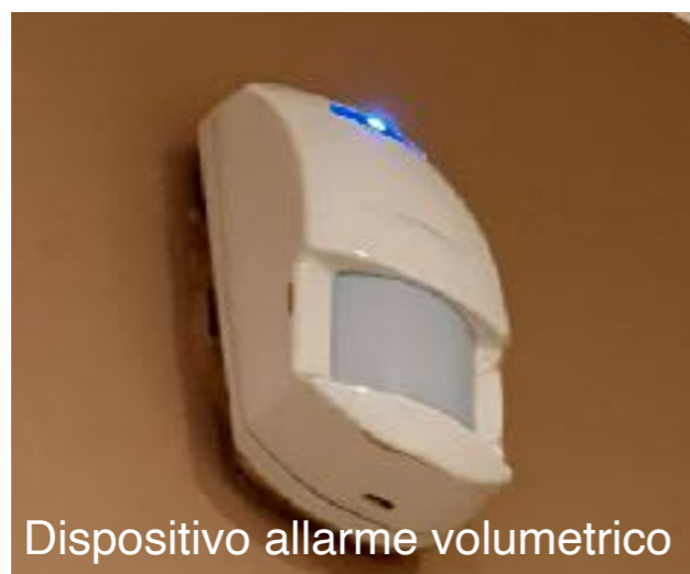
Dispositivo allarme volumetrico