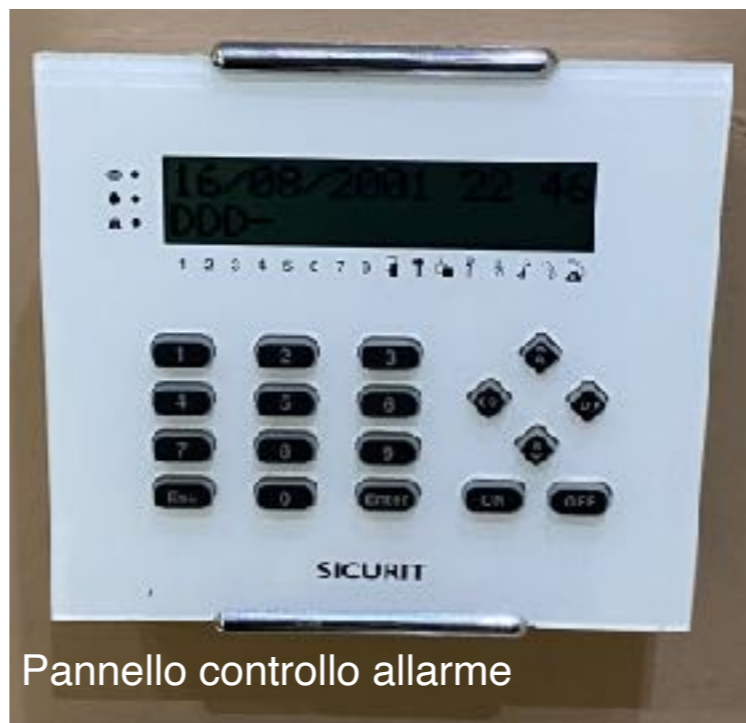
Pannello controllo allarme

Cantina al piano terra di raggiungibile tramite scala comune, o ascensore.