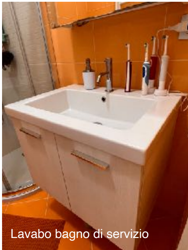
Lavabo bagno di servizio