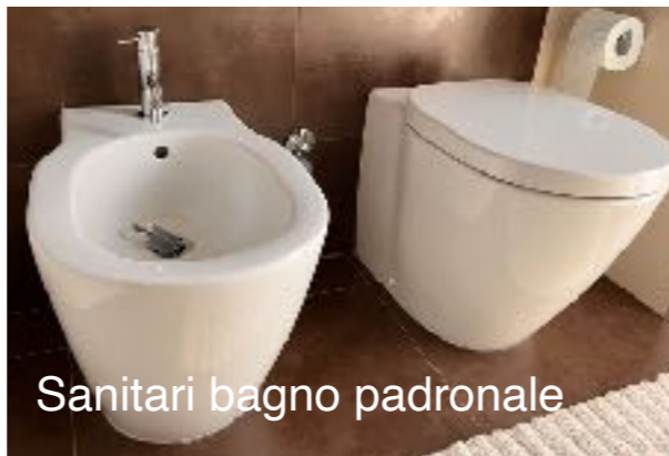
Sanitari bagno padronale

Bagno padronale: lavabo da appoggio bianco opaco su top laminato; sanitari a terra Ideal Standard, modello Connect, filo parete; vasca angolare idromassaggio con pannello di ispezione tondeggiante.