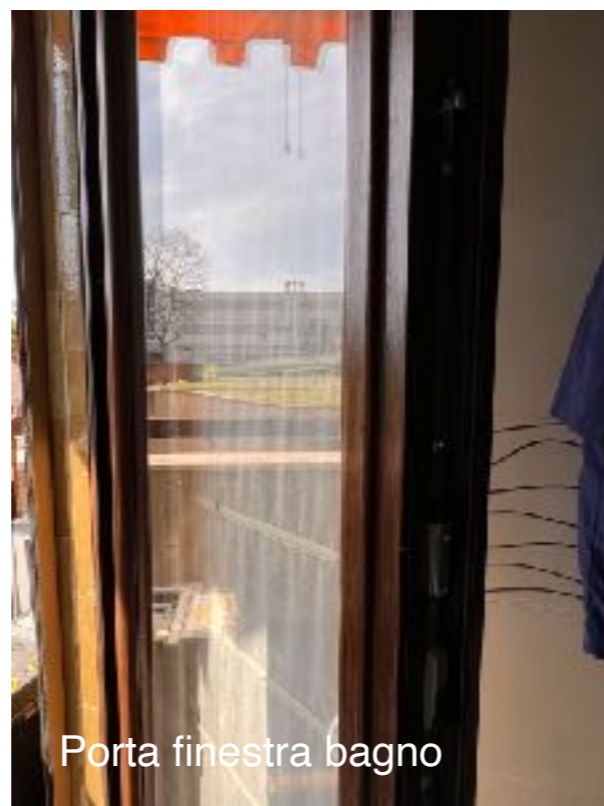
Porta finestra bagno