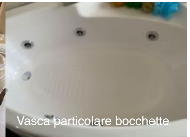
Vasca particolare bocchette