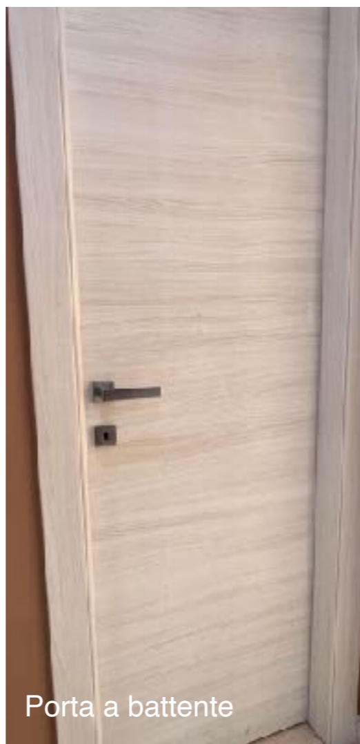
Porta a battente

Portoncino di primo ingresso blindato, serie Ferwua, mod. Blindo con pannello interno in legno venato come le porte interne, maniglia cromo satinata, spioncino, due serrature più catena e nottolino interno inferiore di chiusura.