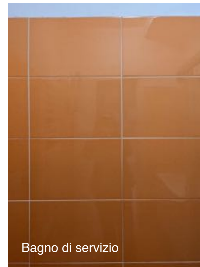
Bagno di servizio